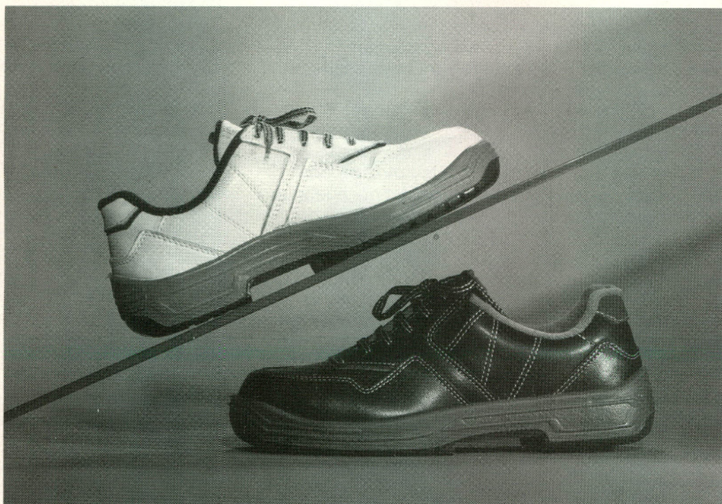
De nieuwe veiligheidsschoen Genius Sport van Gaston Mille. Voorzien van een stalen neus en bestand tegen chemicaliën.